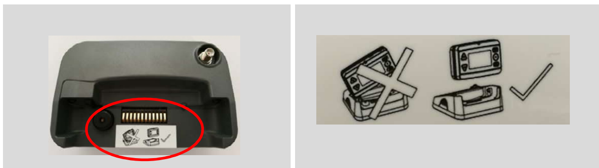
Abbildung 3: Beschriftung auf dem Heimzusatz

Achten Sie bitte auch auf den Hinweis auf dem Heimzusatz: