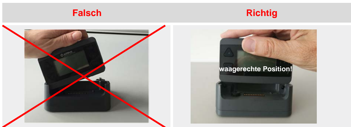
Abbildung 2: Einsetzen des Pagers in den Heimzusatz

Schritt 2: Der Pager soll möglichst gerade (waagerechte Position) in den Heimzusatz eingesetzt werden. Dazu drücken Sie den Pager vorsichtig von oben in waagerechter Position (s. Abbildung 2 rechts) in die Schale des Heimzusatzes. Wenn der Pager in den Verriegelungsmechanismus einrastet, sind zwei Klickgeräusche zu hören.